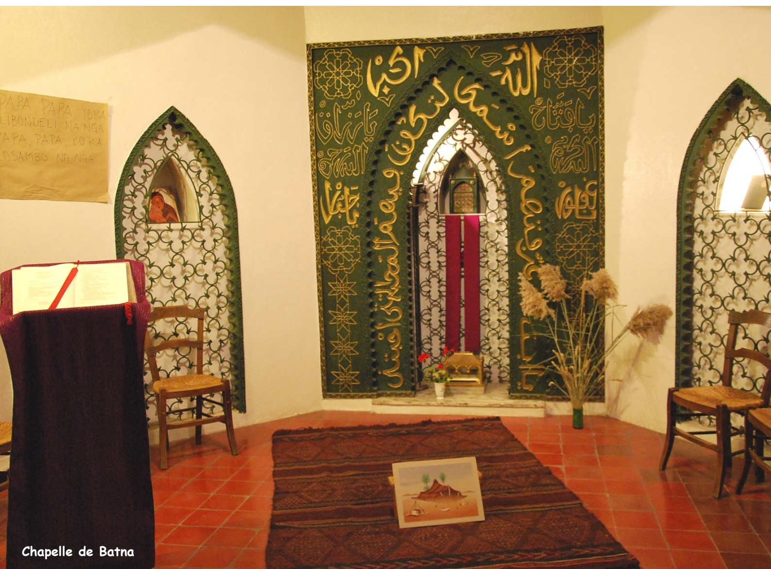
Chapelle de Batna

90 ème année n° 6 janvier - février 2011