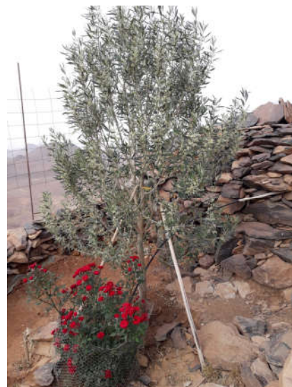
À l'Assekrem, olivier et rosier sont en fleurs

Le service interdiocésain de la Coopération Missionnaire invite chaque diocèse à vivre le mois d'octobre 2019 unis dans la prière de louange et d'intercessions. Il propose pour cela de s'appuyer sur des témoins de l'Église. Notre diocèse se laissera guider par sainte Joséphine Bakhita, originaire du Soudan et la bienheureuse Victoire Rasoamanarivo, originaire de Madagascar. Nous découvrirons ces témoins de notre Église diocésaine et ceux des autres diocèses de l'Église en Algérie dans un document, en préparation.