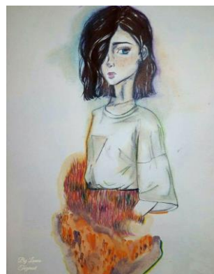
« Indigo Child », Lamia