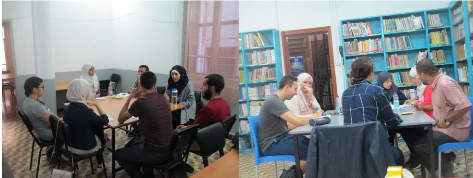
Groupes de conversation : Anglais et Français