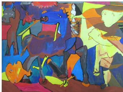
« Guernica », version Wafa