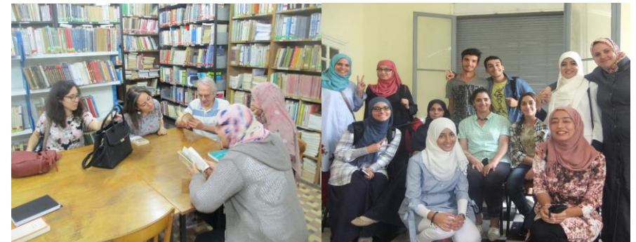
Rencontre littéraire et Groupe de Parole