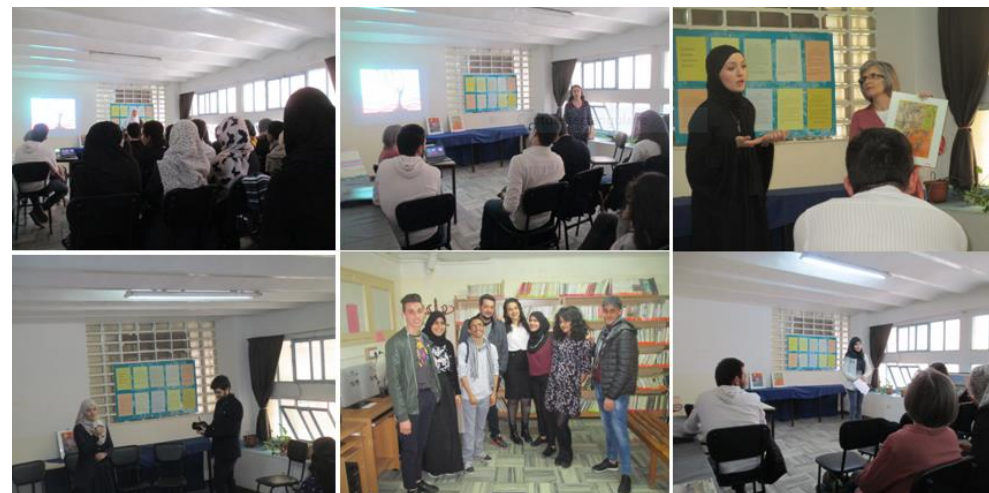
Expression artistique : peinture, théâtre, chant...