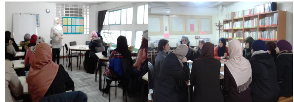
Formations au CCU SH