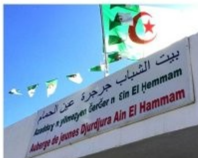
Hébergement dans l'auberge des jeunes.

Depuis 2011 l'École de la différence est une expérience unique et positive de la diversité culturelle pour les jeunes vivant en Algérie. Plus de 175 jeunes y ont participé!